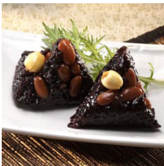
台灣好粽-紫米蓮子粽