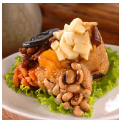
素天下古早味養生粽